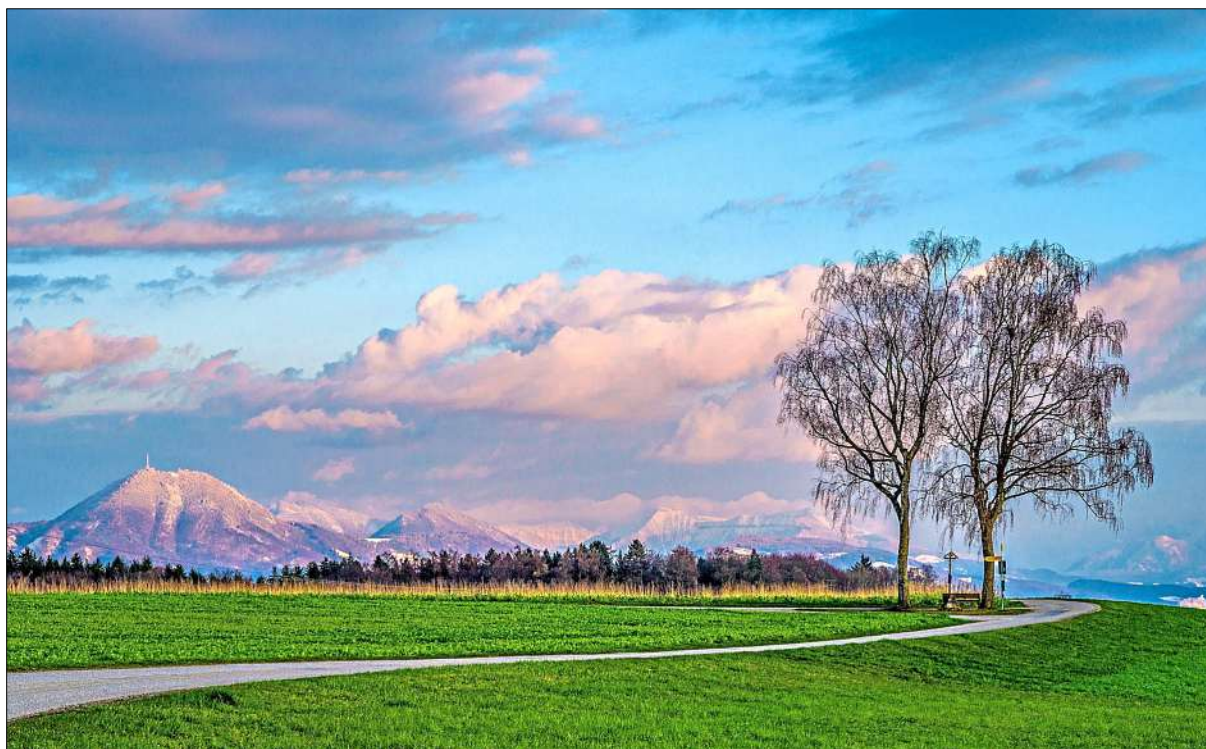
Ein Temperatursturz sorgte nochmal dafür, dass die Berggipfel angezuckert wurden. Hier der Blick von Abtsdorf aus.

Am Abend des 14. überquerte die schwache Kaltfront eines Tiefs über Schweden Bayern mit auffrischem Westwind und leichtem