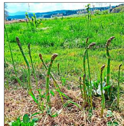
Zur Ernte bereit: Der grüne Spargel, ein mehrjähriges Gemüse.

Graphik und Marketing arbeitete. Sie habe den Acker, kleine Foliengewächshäuser und einen Bauwagen für die Gartengeräte, ein festes Gebäude gebe es nicht. Die Maschinen dürfe sie bei einem Nachbarn einstellen.