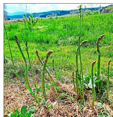
Zur Ernte bereit: Der grüne Spargel, ein mehrjähriges Gemüse.

Graphik und Marketing arbeitete. Sie habe den Acker, kleine Folien-gewächshäuser und einen Bauwagen für die Gartengeräte, ein festes Gebäude gebe es nicht. Die Maschinen dürfe sie bei einem Nachbarn einstellen.