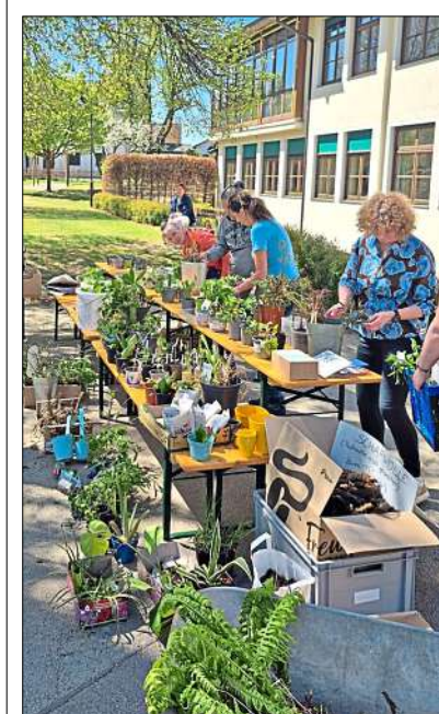
Bei sonnigem Wetter und milden Temperaturen wurden die Pflanzen zum Tausch auf dem Schulhof präsentiert.

Saaldorf. Zur diesjährigen Pflanzentauschbörse durfte der Obst- und Gartenbauverein Saaldorf viele Hobbygärtnerinnen und -gärtner, die recht fleißig viele „Schätze“ aus ihren Gärten mitgebracht haben, begrüßen. Erstmalig wurden die angebotenen Stauden, Setzlinge, Sträucher, Zimmerpflanzen, Samen, Gartenlektüren und Biodünger nun im Frühling zum Tausch auf dem Saaldorfer Schulhof präsentiert, berichtet der Verein.