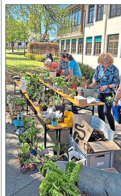
Bei sonnigem Wetter und milden Temperaturen wurden die Pflanzen zum Tausch auf dem Schulhof präsentiert.

Saaldorf. Zur diesjährigen Pflanzentauschbörse durfte der Obst- und Gartenbauverein Saaldorf viele Hobbygärtnerinnen und -gärtner, die recht fleißig viele „Schätze“ aus ihren Gärten mitgebracht haben, begrüßen. Erstmalig wurden die angebotenen Stauden, Setzlinge, Sträucher, Zimmerpflanzen, Samen, Gartenlektüren und Biodünger nun im Frühling zum Tausch auf dem Saaldorfer Schulhof präsentiert, berichtet der Verein.